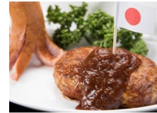
お子様セット ハンバーグ・サラダ・ ウィンナー・ごはん・デザート ¥ 1,980 (税込)