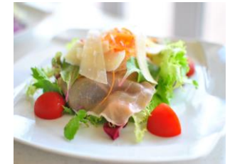
生ハムとチーズの グリーンサラダ ¥ 1,280 (税込)