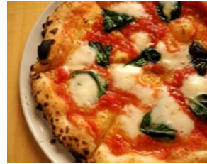
サラミの マルゲリータ ¥ 1,650 (税込)