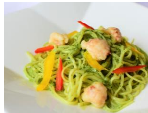
団扇海老の バジルクリーム スパゲッティ ¥ 1,450 (税込)