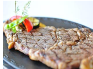
熟成肉のステーキ 150 g ¥ 1,750 (税込) 200 g ¥ 2,450 (税込)