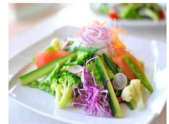
コンビネーションサラダ ¥ 950 (税込)

オードブル パスタ (チョイス) ピザ (チョイス) デザート コーヒーor紅茶