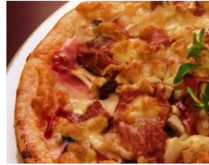
クアトロチーズピザ ¥ 1,750 (税込)