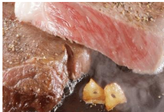
周防高森和牛ステーキ 80 g ¥ 3,550 (税込)