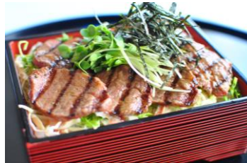
周防高森和牛 ステーキ重 (スープ付) ¥ 2,750 (税込)