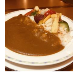
彩り野菜の カレー ¥ 1,200 (税込)