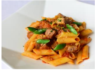
豚肉の トマト煮込みソース ペンネリガーテ ¥ 1,450 (税込)